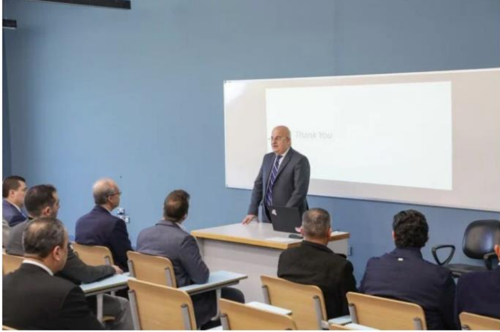
وكالة الجامعة الإخبارية